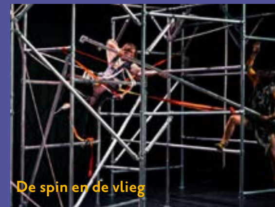
De spin en de vlieg

Deze voorstellingen zijn geboekt vanuit de samenwerking tussen Clink!, de Theaterkerk en TOP